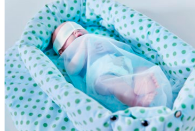
BiliTex tissu 60x60cm REF 18-06-100